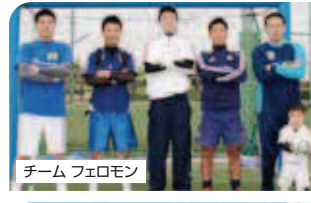
チーム フェロモン