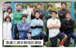
急遽三浦半島地区選抜