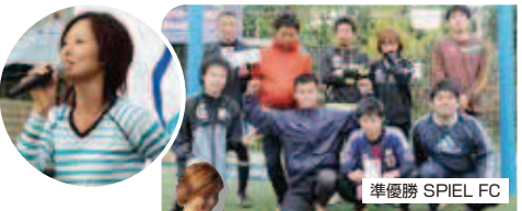
準優勝 SPIEL FC